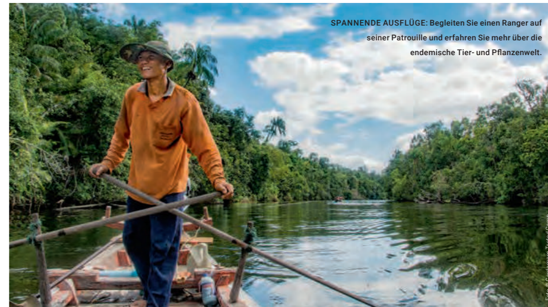
SPANNENDE AUSFLÜGE: Begleiten Sie einen Ranger auf seiner Patrouille und erfahren Sie mehr über die endemische Tier- und Pflanzenwelt.

DAS CARDAMOM TENTED CAMP liegt im dichten Dschungel des Botum Sakor Nationalparks, direkt am Preak Tachan River. Die herrliche Gegend lädt zu Erkundungstouren ein.